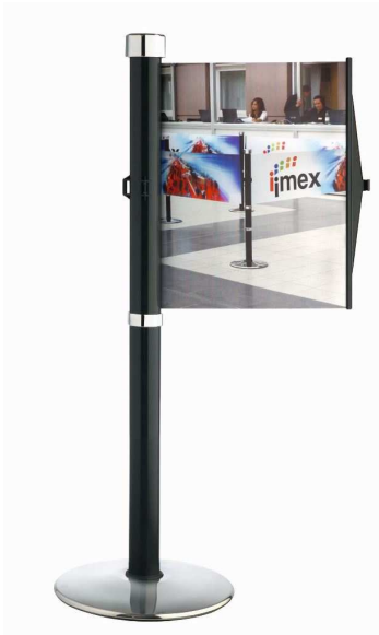
Abb. 1: GLA 30-A