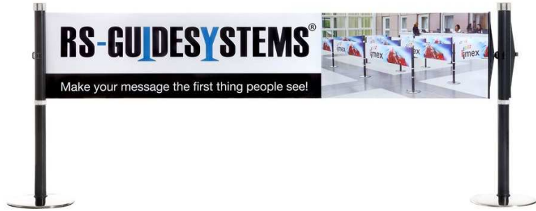
Abb. 2: Anwendungsbeispiel