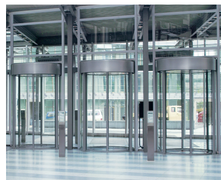
Sicherheitsrundscheule: Personenvereinzlung mit viel Transparenz auf kleinstem Raum

In Verbindung mit einem Zutrittskontrollsystem lässt sich die Personenvereinzlung in sicherheitssensiblen Gebäuden oder Gebäudebereichen zuverlässig kontrollieren. Ob mit Chip, Karte oder Fingerscan: Die Sicherheitskarusselltüren und Sicherheitsrundscheulen lassen sich flexibel an unsere oder an marktübliche Zutrittskontrollsysteme anpassen. Damit bieten sie maximale Flexibilität im Neubau und in der Nachrüstung.