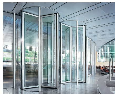
Sicherheitskarusselltür für sichere Zutrittskontrolle: unberechtigte Personen werden entgegen der Durchgangsrichtung aus der Tür geleitet