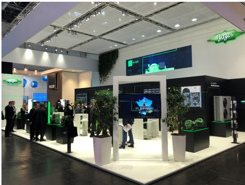
Bild 2: Auf der EuroShop 2020 können Besucher sich weiter über das BITZER Digital Network informieren