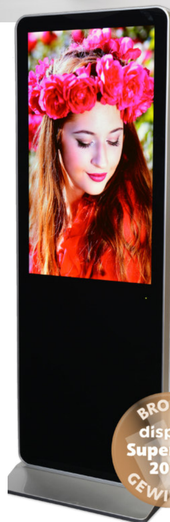
AromaStreamer® 1400 (Video-Duft-Display) BRONZE GEWINNER des „display Superstar 2019“ Awards