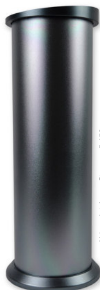
Abb. zeigt AromaStreamer® 450